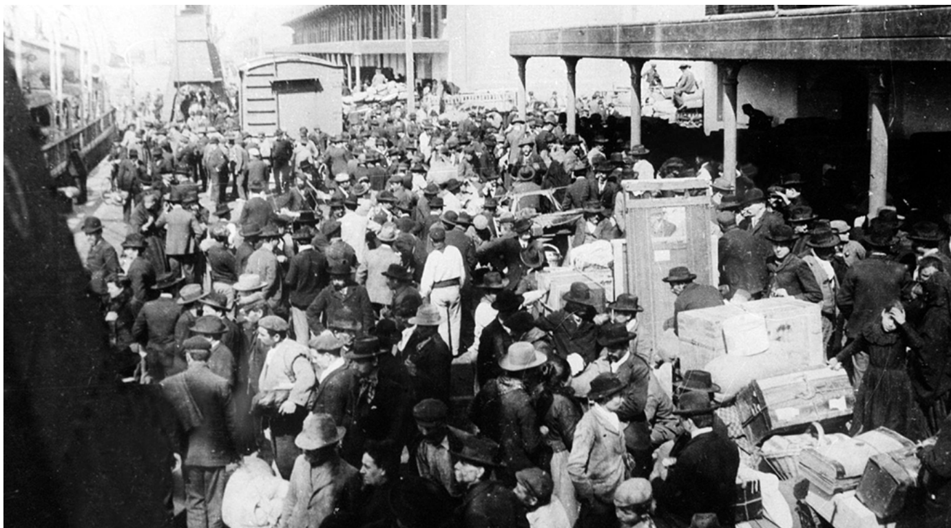
Emigrantes a la espera de trámites en la aduana