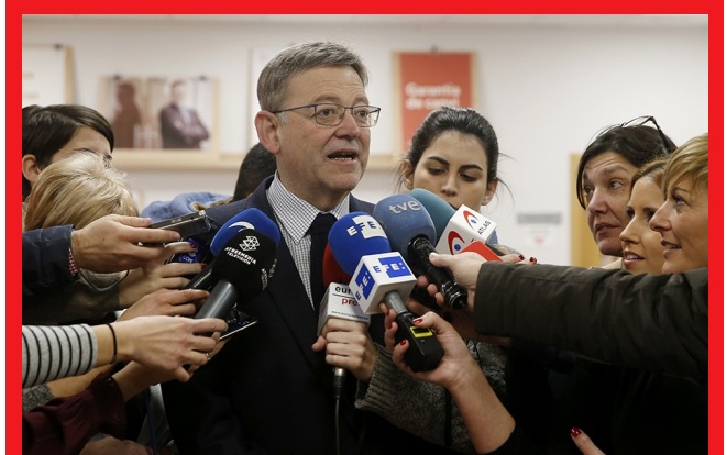
El presidente de la Generalitat, Ximo Puig

El presidente de la Generalitat, Ximo Puig, expresó ayer su "preocupación" por la "prehuelga" de la estiba, consideró "lamentable" que los trabajadores "no utilicen los cauces oportunos" y añadió: "Si se quiere hacer huelga, que se haga huelga". Así lo ha manifestado en declaraciones a los medios antes de su visita a las fallas de Blanquerías, Na Jordana y Els Furs, a preguntas de los periodistas sobre el debate de convalidación