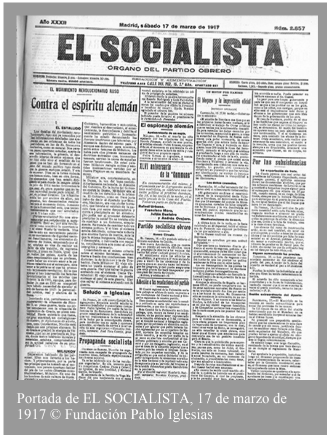
Portada de EL SOCIALISTA, 17 de marzo de 1917